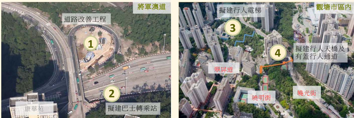
將軍澳道支路鋪設雨水渠