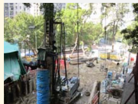
秀茂坪紀念公園建造行人電梯地基