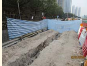
將軍澳道旁建造護土牆