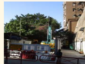
曉華大廈旁建造升降機塔及有蓋行人通道地基